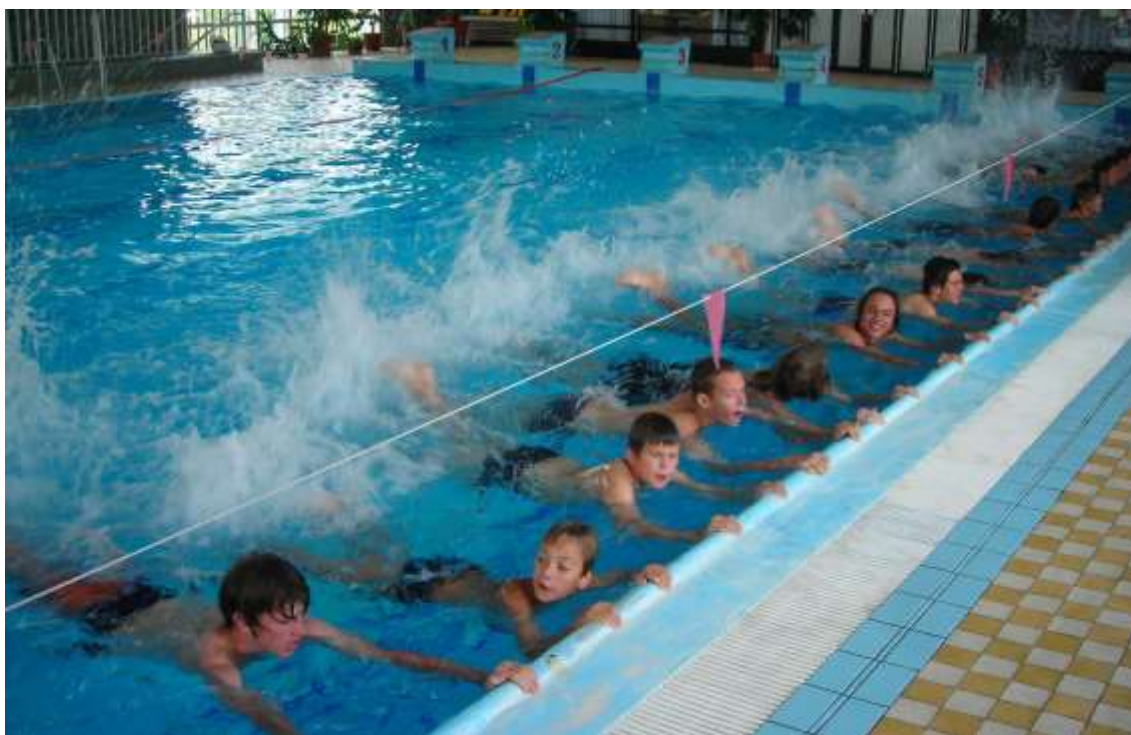
Součást výcviku při soustředění žactva v bazénu Sportlife centra Rumburk

Stejně jako loni i na jaře roku 2011 se klub soustředil na přípravu soustředění hráčů žákovských a mládežnických kategorií. Na týden 19. až 24. července 2011 naplánoval soustředění juniorů a kadetů v Lesné u Jiřetína pod Jedlovou a o měsíc později, 27. srpna až 3. září, se soustředění ve Sportlife centru Rumburk zúčastnily děti a mládež.