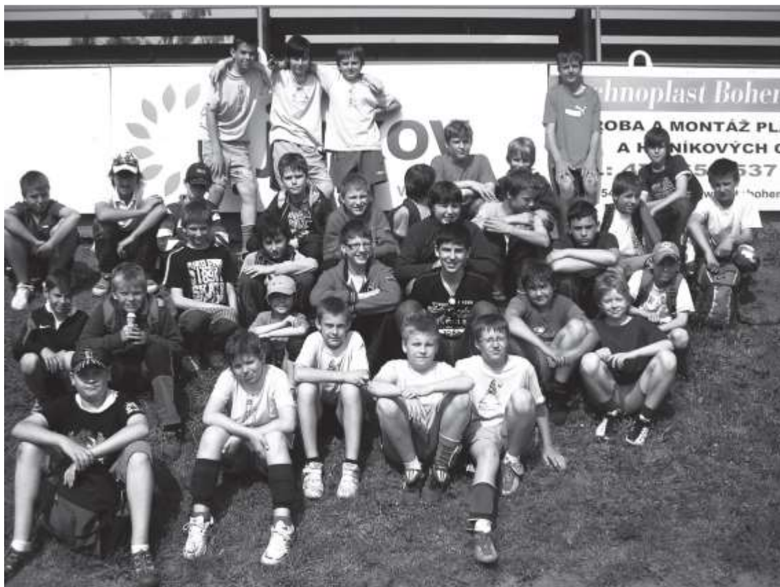
Skupinový snímek části účastníků turnaje.

Pořadí: 1. RH Dubí A, 2. ISŠTE Sokolov A, 3. SKV Ústí n/L B, 4. RH Dubí B, 5. Borek Ostrov, 6. SKV Ústí n/L A, 7. SKV Ústí n/L C, 8. ISŠTE Sokolov B, 9. VK Ervěnice A, 10. VK Ervěnice B.